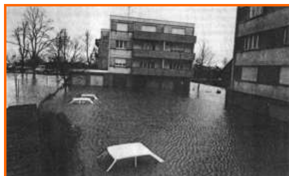
Crue du Giessen à Sélestat en 1990